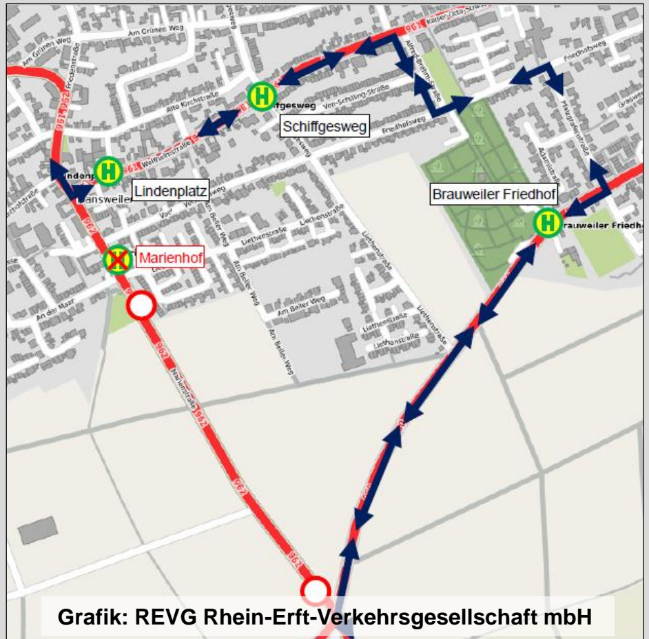
Grafik: REVG Rhein-Erft-Verkehrsgesellschaft mbH

Sobald dazu Information der REVG vorliegen, finden Sie diese im SPD-Schaukasten an der Wolfhelmschule und den Haltestellen.