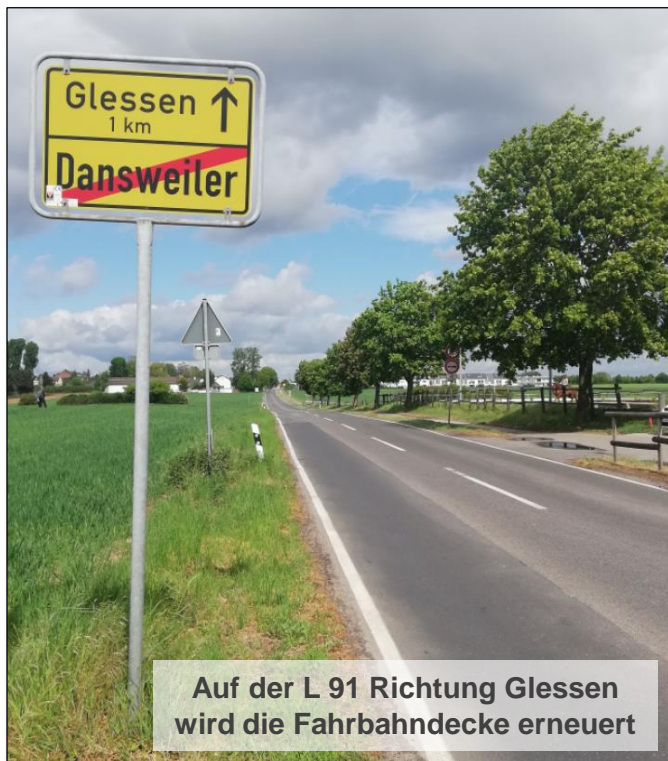
Auf der L 91 Richtung Glessen wird die Fahrbahndecke erneuert

Meine Anfrage im Ausschuss für Tiefbau und Verkehr bestätigte geplante Arbeiten an der Landstraße 91 (L91). Daraufhin hatte ich in der Sache frühzeitig Kontakt zum Landesbetrieb Straßen.NRW und der REVG Rhein-Erft-Verkehrsgesellschaft mbH.